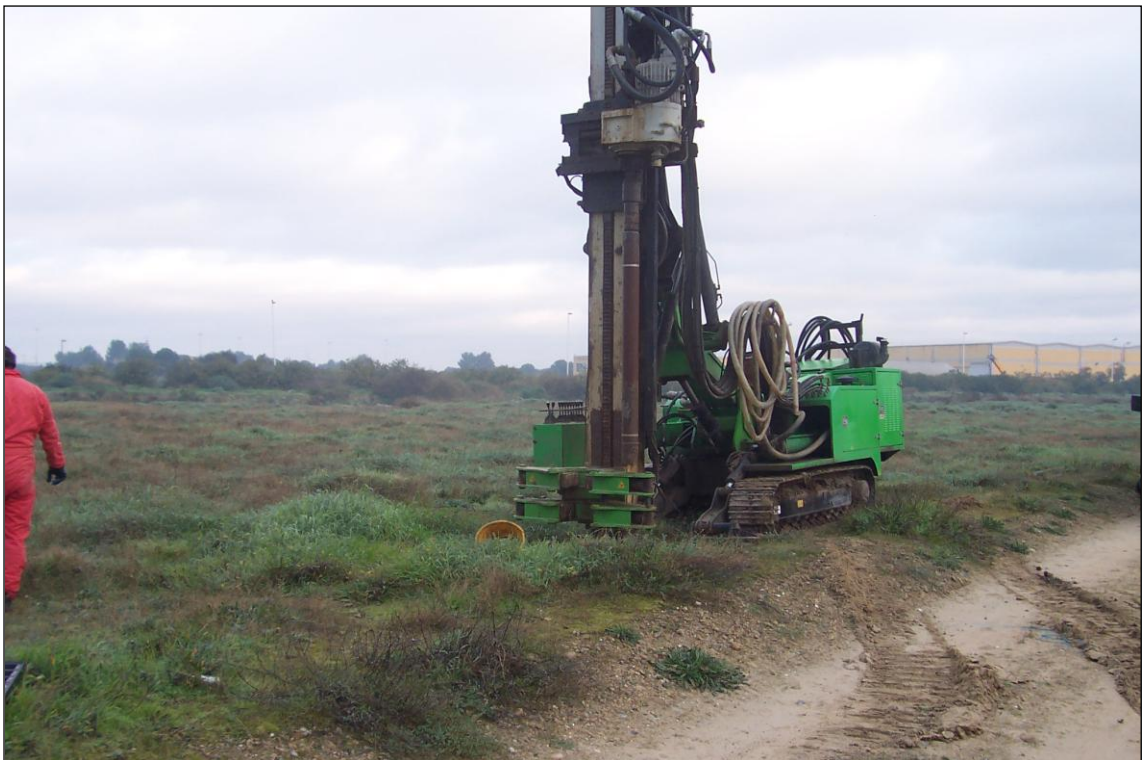
SONDAGGIO S4 – Posizionamento