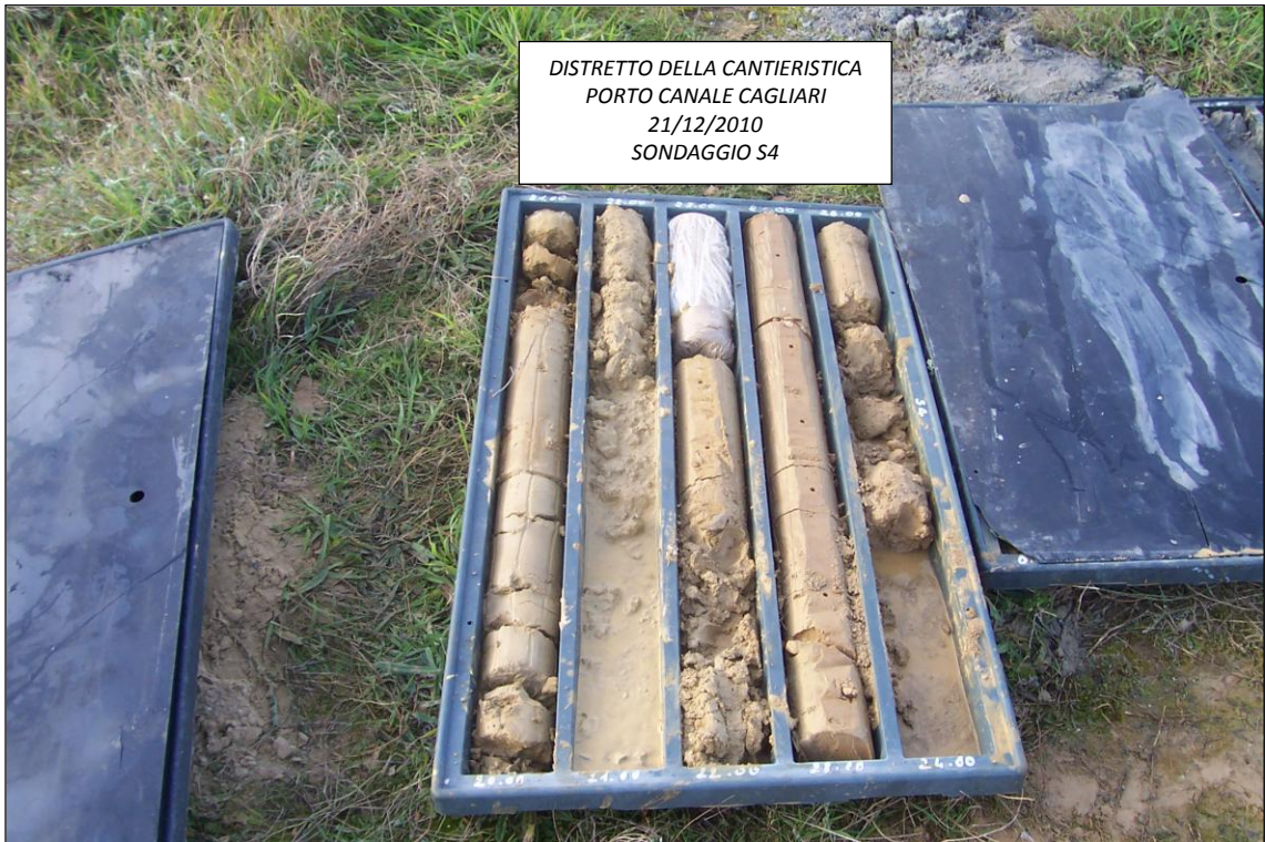
SONDAGGIO S4 – 20,00 ÷ 25,00 m