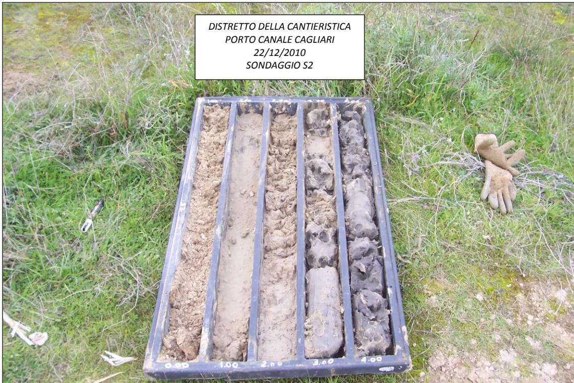
SONDAGGIO S2 – 0,00 ÷ 5,00 m