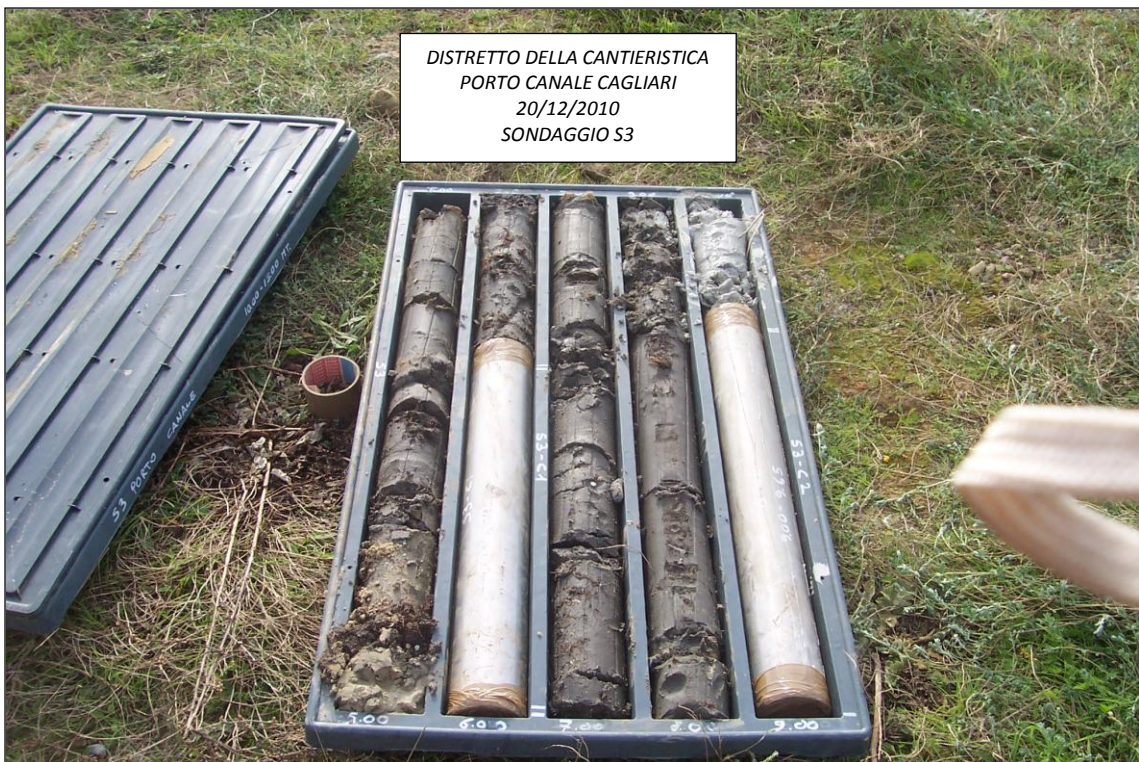
SONDAGGIO S3 – 5,00 ÷ 10,00 m