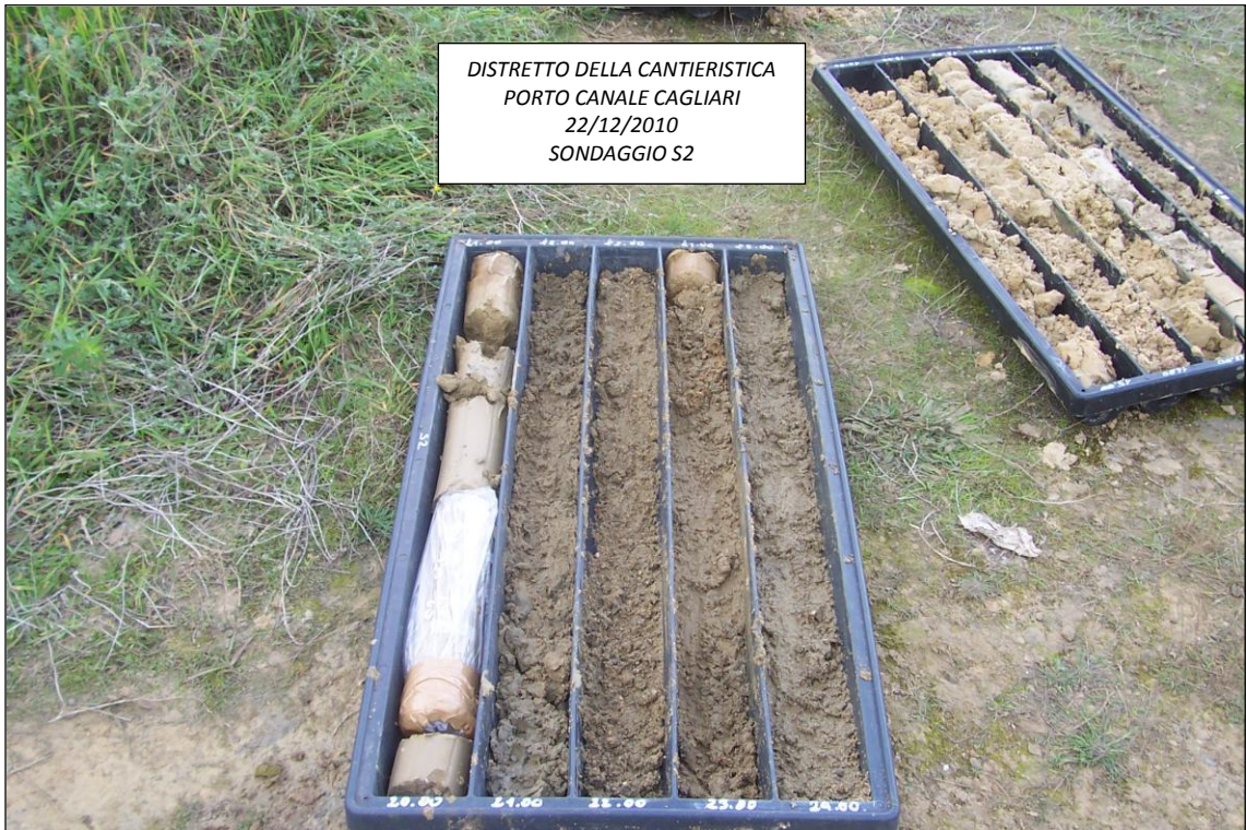
SONDAGGIO S2 – 20,00 ÷ 25,00 m