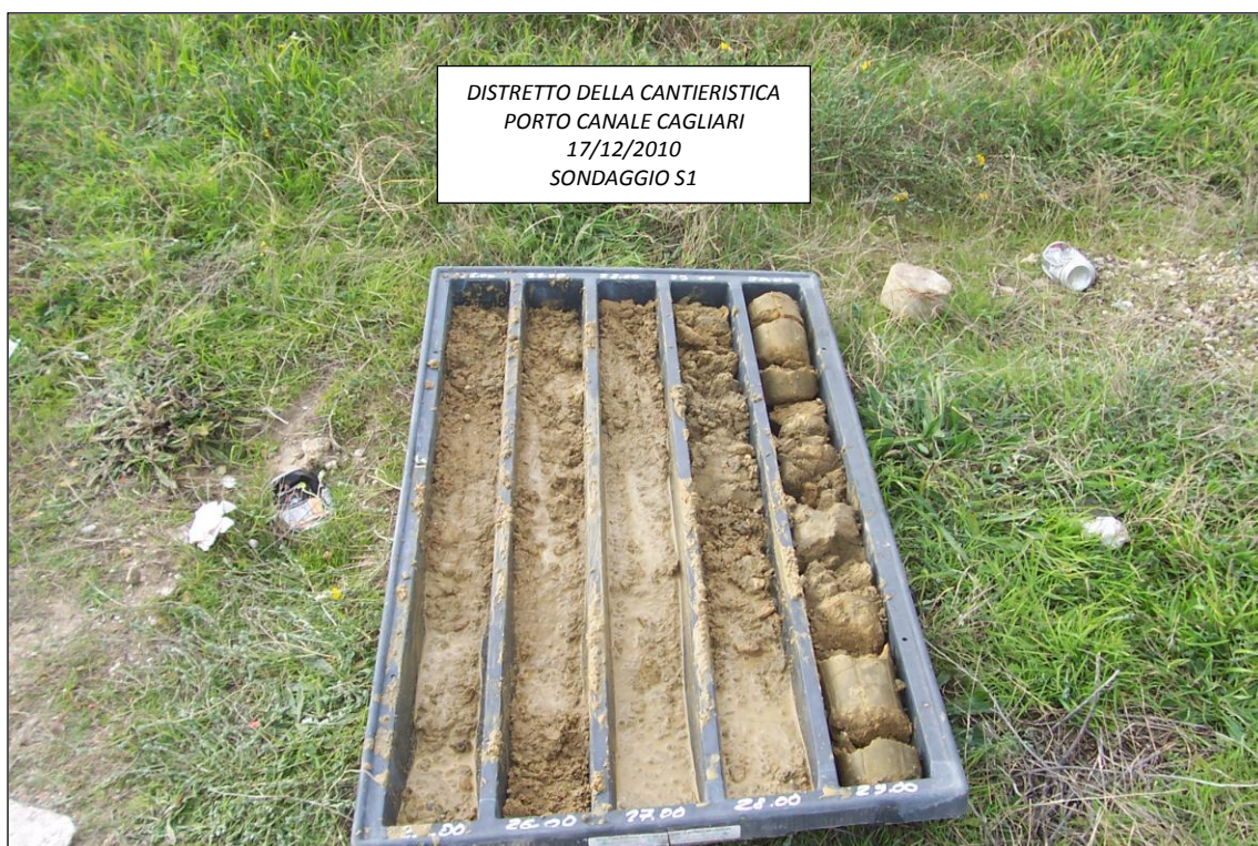
SONDAGGIO S1 – 25,00 ÷ 30,00 m