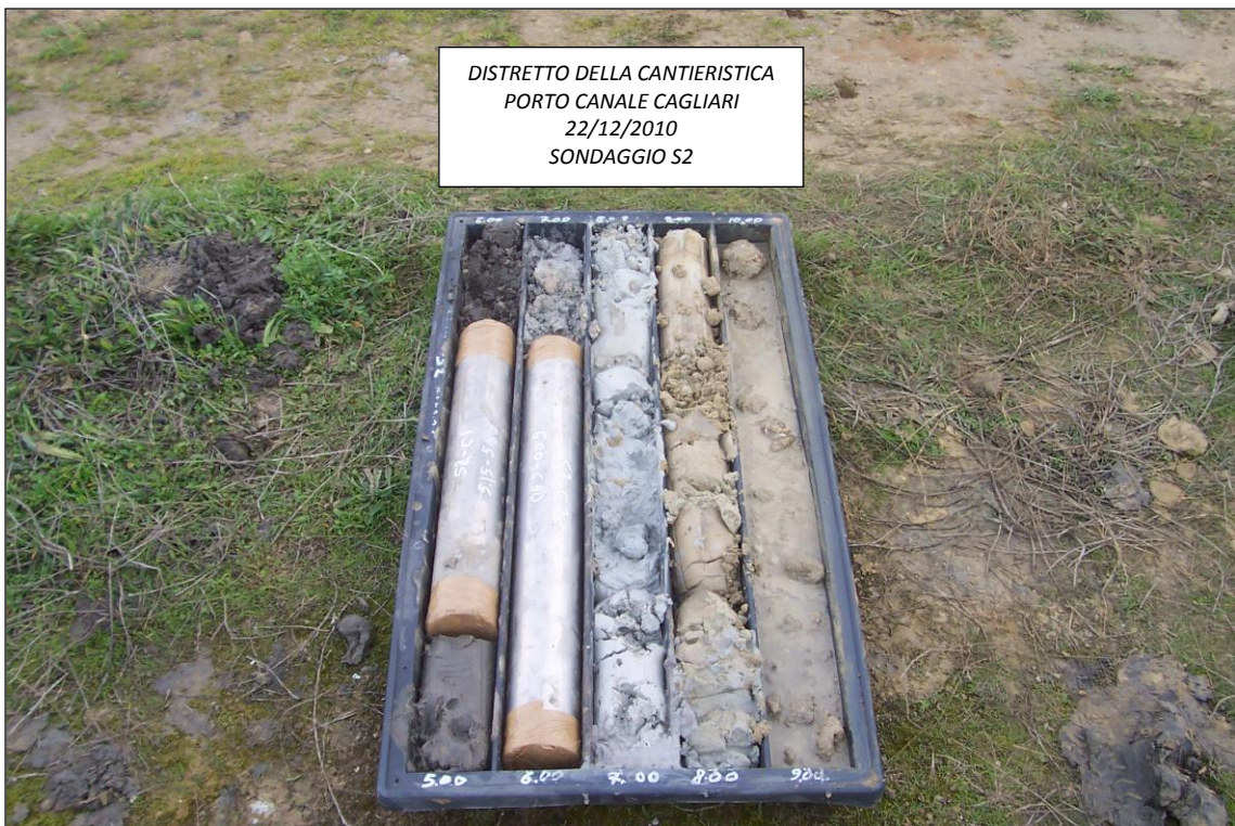
SONDAGGIO S2 – 5,00 ÷ 10,00 m