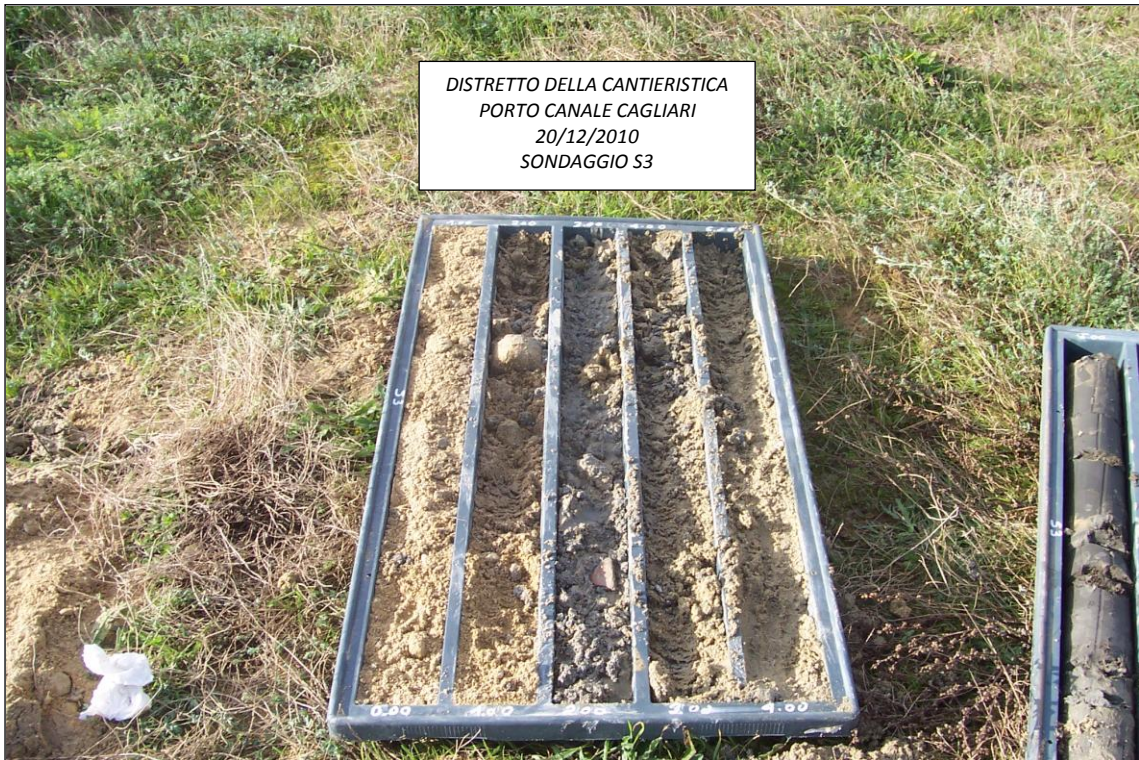
SONDAGGIO S3 – 0,00 ÷ 5,00 m