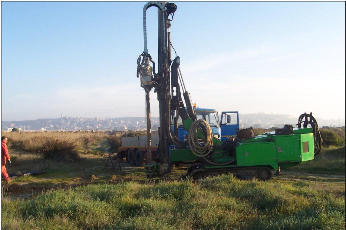
SONDAGGIO S2 – Posizionamento