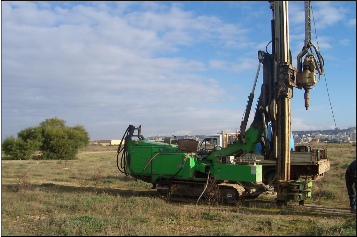
SONDAGGIO S3 – Posizionamento