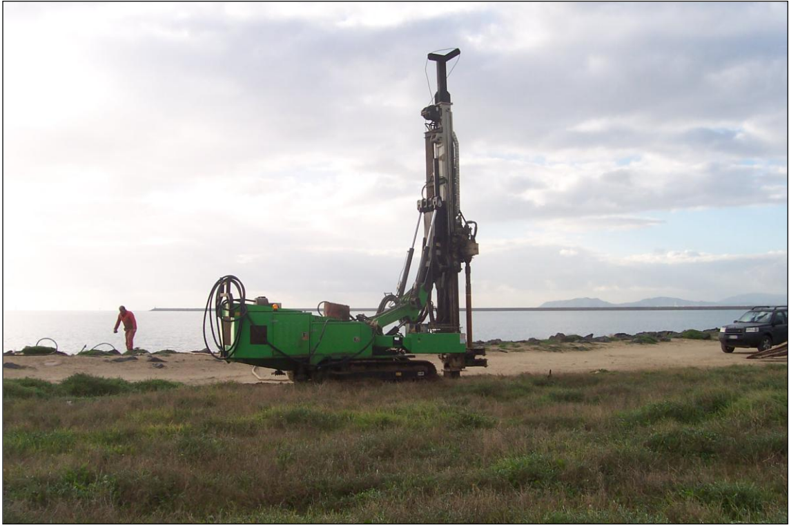
SONDAGGIO S1 – Posizionamento