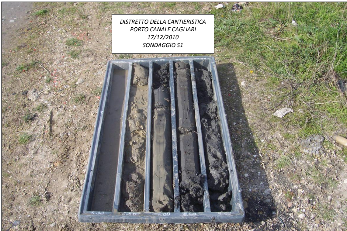
SONDAGGIO S1 – 5,00 ÷ 10,00 m