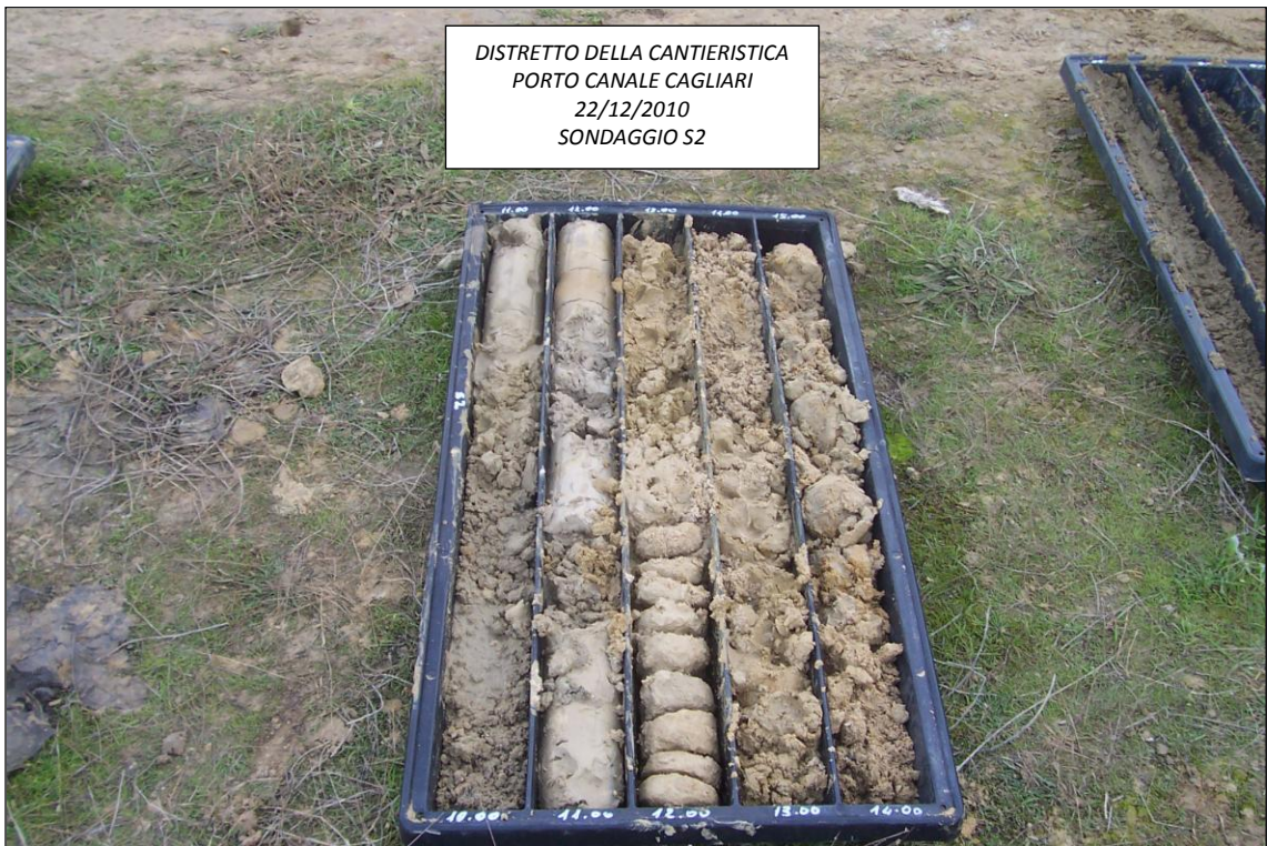
SONDAGGIO S2 – 10,00 ÷ 15,00 m