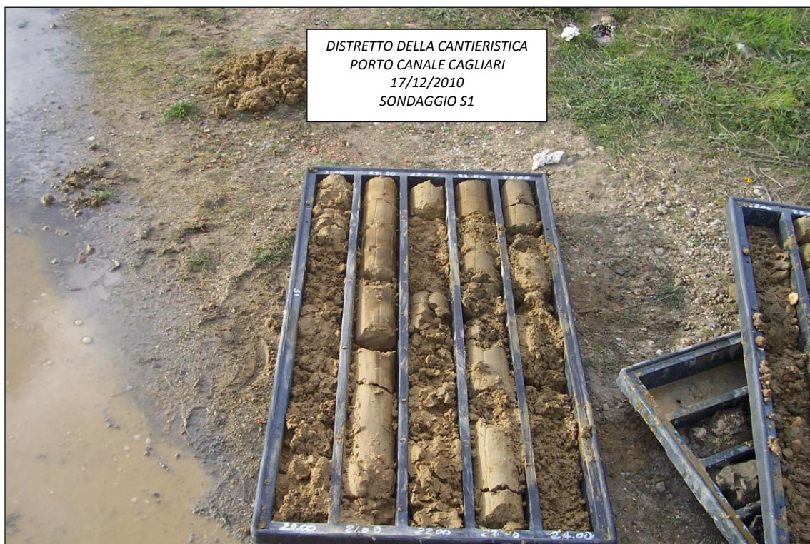
SONDAGGIO S1 – 20,00 ÷ 25,00 m