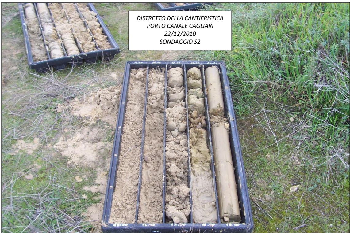
SONDAGGIO S2 – 15,00 ÷ 20,00 m