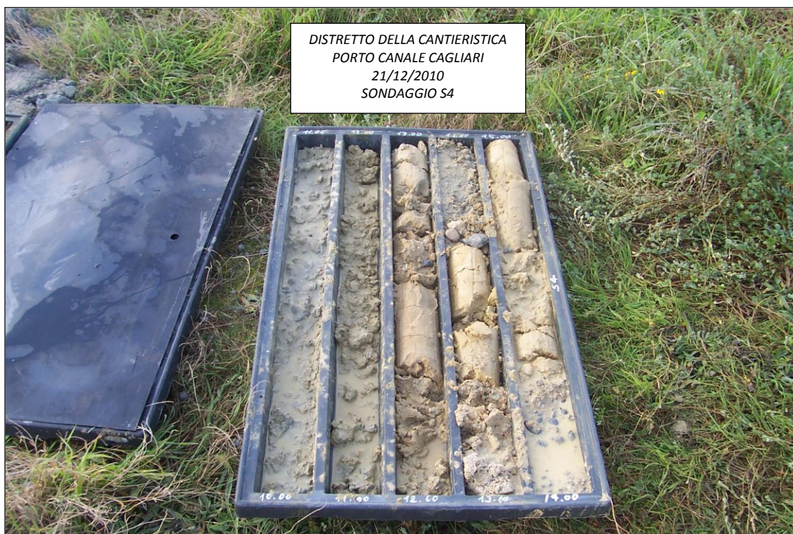
SONDAGGIO S4 – 10,00 ÷ 15,00 m