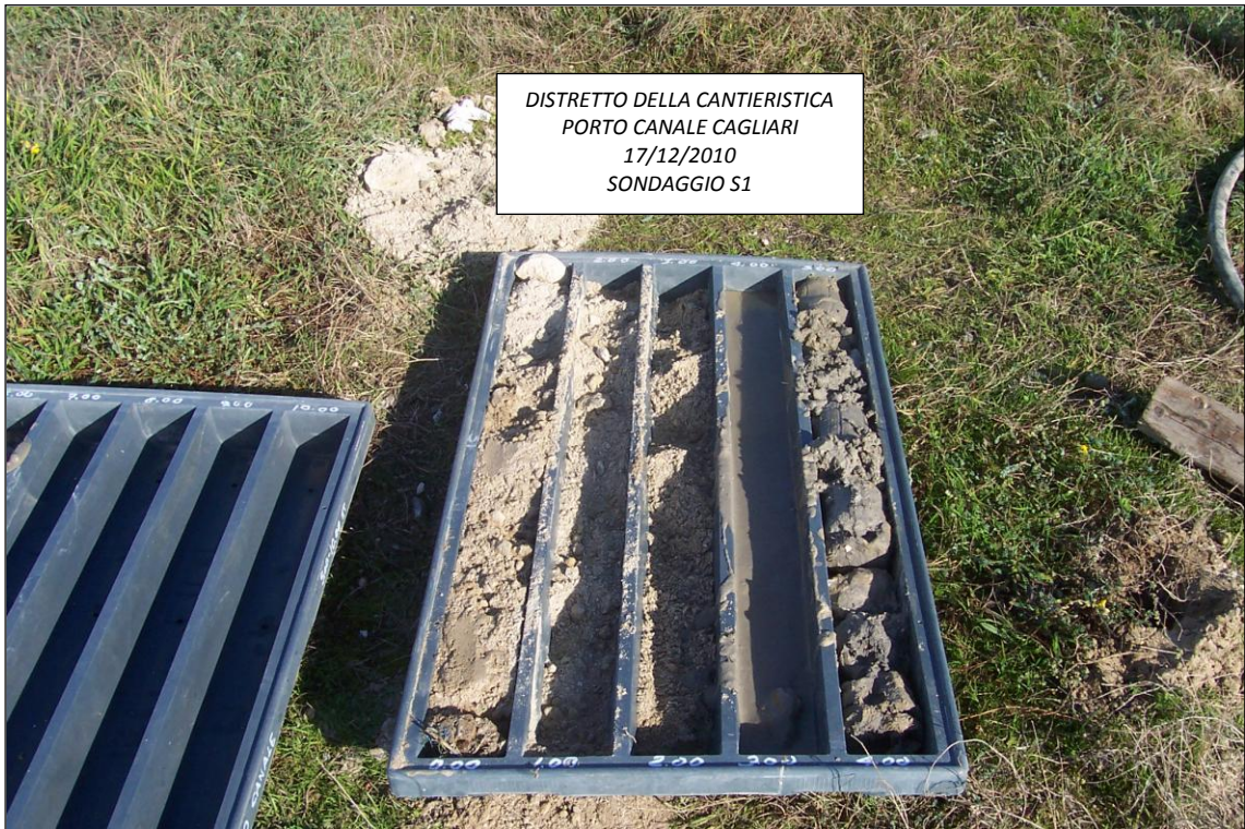
SONDAGGIO S1 – 0,00 ÷ 5,00 m