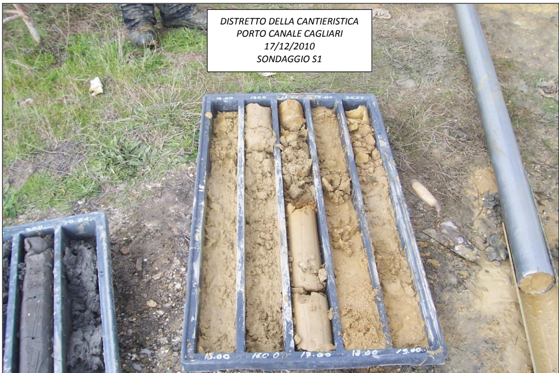
SONDAGGIO S1 – 15,00 ÷ 20,00 m