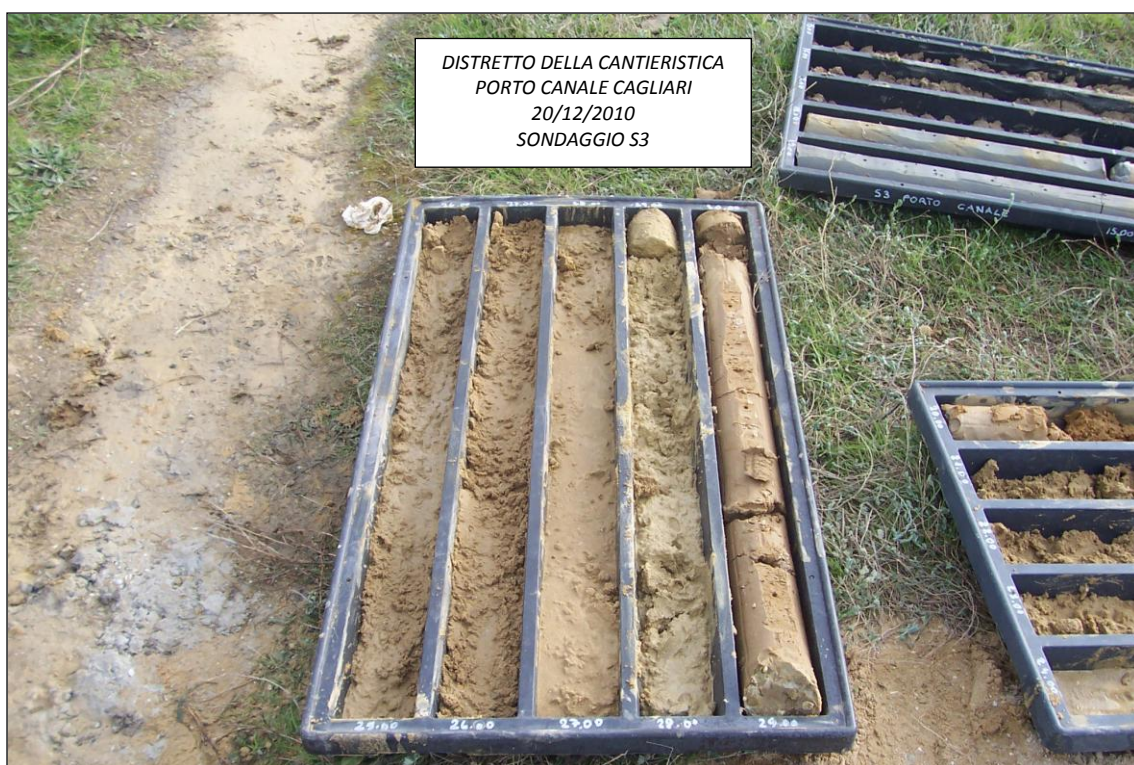
SONDAGGIO S3 – 25,00 ÷ 30,00 m