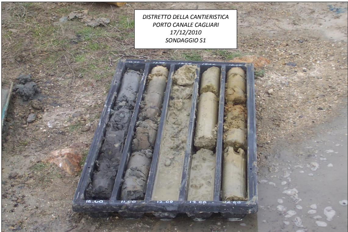
SONDAGGIO S1 – 10,00 ÷ 15,00 m