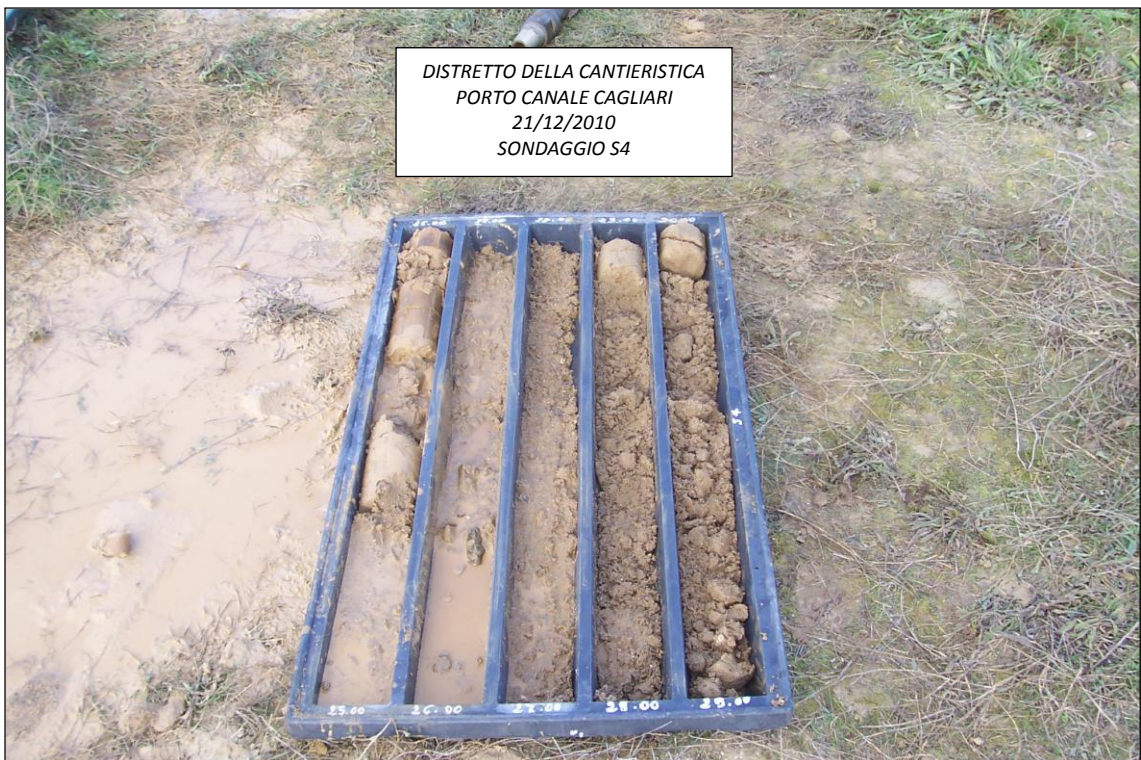
SONDAGGIO S4 – 25,00 ÷ 30,00 m