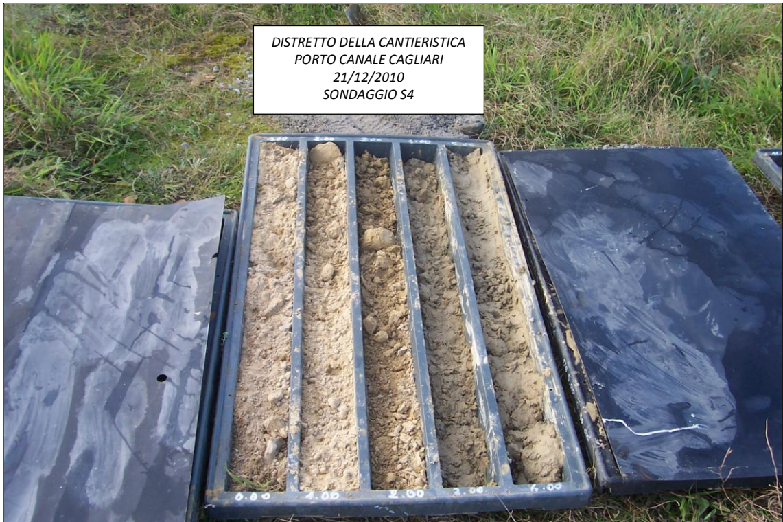
SONDAGGIO S4 – 0,00 ÷ 5,00 m