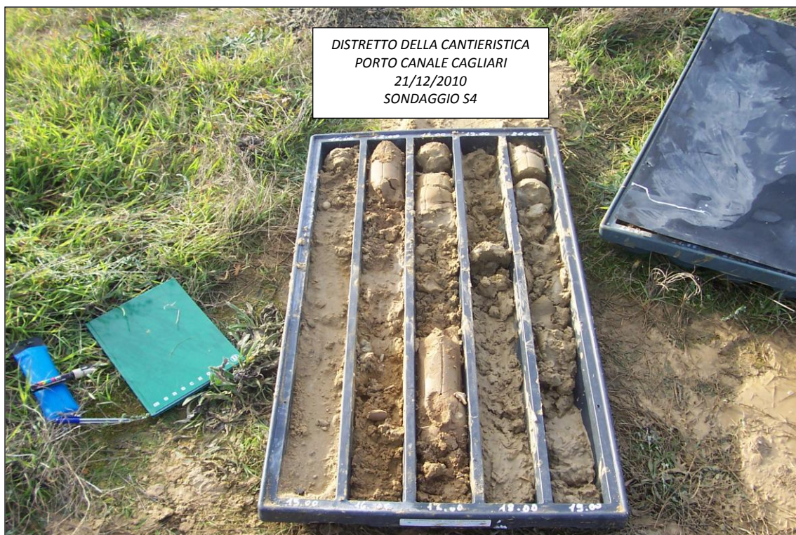
SONDAGGIO S4 – 15,00 ÷ 20,00 m