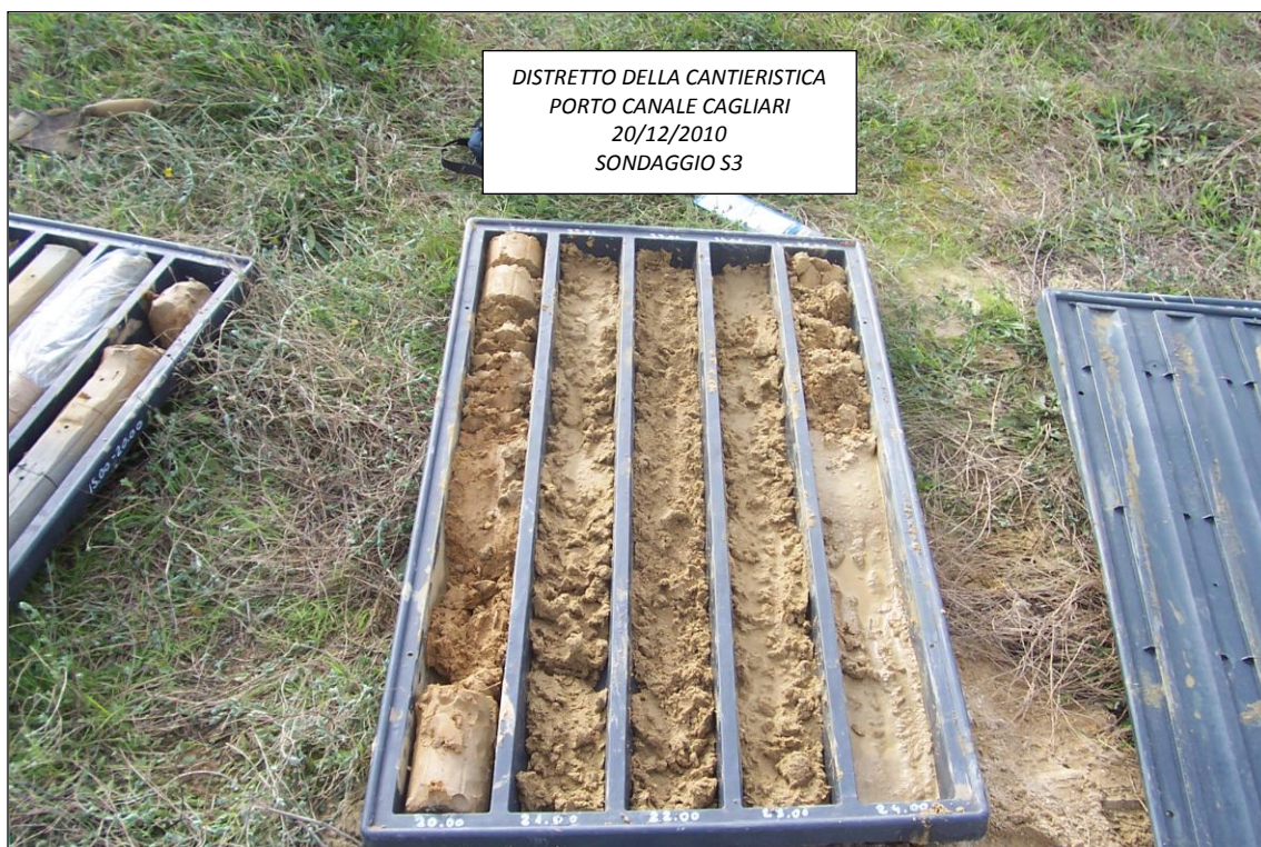
SONDAGGIO S3 – 20,00 ÷ 25,00 m