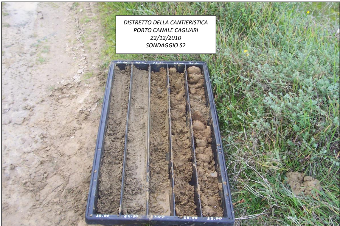
SONDAGGIO S2 – 25,00 ÷ 30,00 m