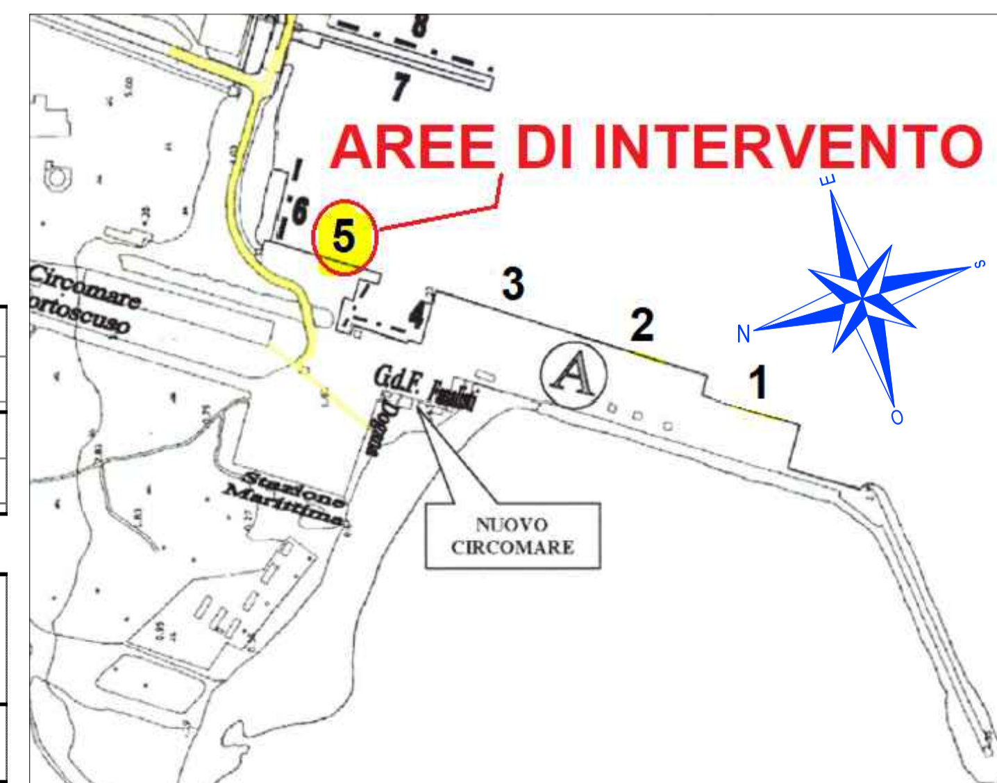
TAVOLA 1A PLANIMETRIA INTERVENTI PUNTUALI ACCOSTO 5 INSTALLAZIONI

Il Responsabile Unico del Procedimento: Per. Ind. Damiano Delussu